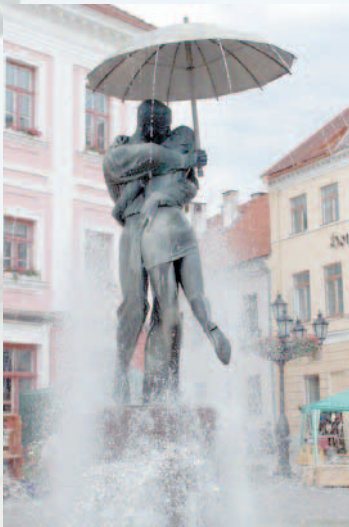
Фонтан «Двое под дождем» в г. Тарту