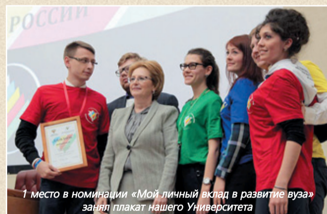
1 место в номинации «Мой личный вклад в развитие вуза» занял плакат нашего Университета

По итогам работы Форума принята резолюция. Материалы Форума опубликованы на сайте студфорум.рф .