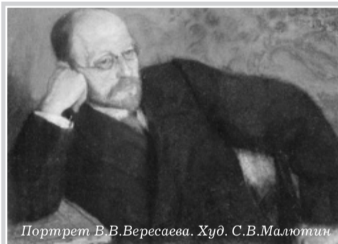
Портрет В.В.Вересаева. Худ. С.В.Малютин