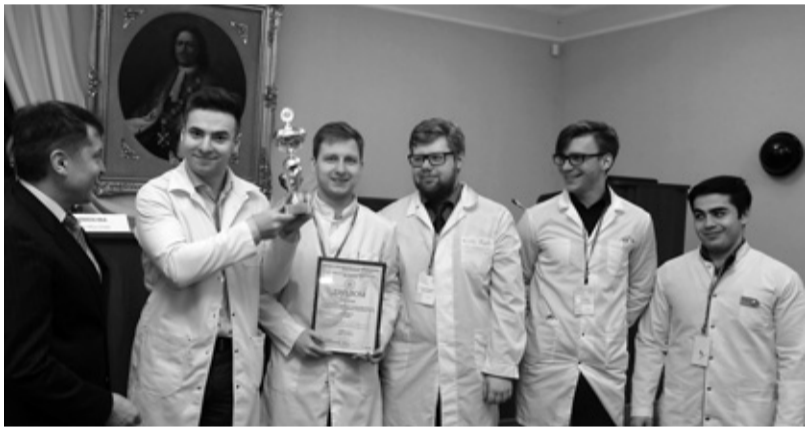
Команда нашего Университета заняла второе место и стала лучшей в номинации «Лучшее клиническое мышление».

Завершением дня стало подведение итогов и награждение победителей, призеров и номинантов олимпиады, которые получили дипломы и кубки, были отмечены в номинациях от Российского общества симуляционного обучения в медицине.