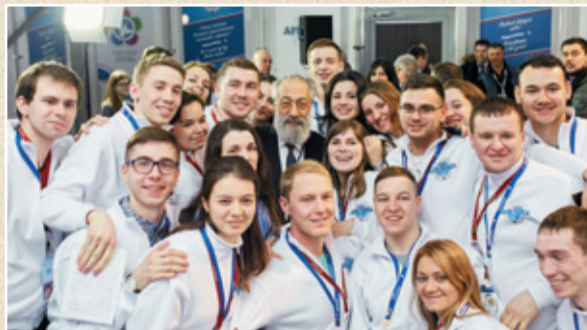
Окончание на с. 4.

V Международный арктический форум «Арктика — территория диалога» пройдет в 2019 г.