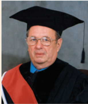
Продолжение темы на с. 7.

Почетного доктора Университета заслуженного деятеля науки РФ доктора медицинских наук