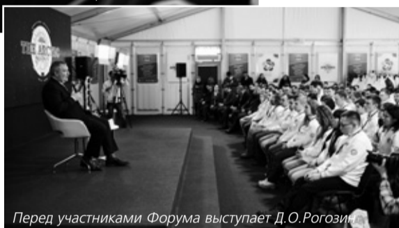
Перед участниками Форума выступает Д.О.Рогозин