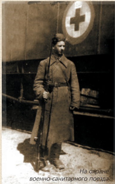
На охране военно-санитарного поезда