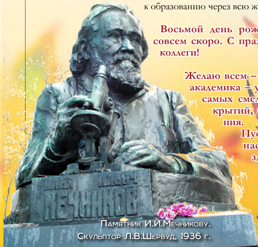
Памятник И.И. Мечникову. Скульптор Л.В. Шервуд, 1936 г.

Пусть успех каждого из нас станет успехом в здравоохранении страны. И пусть будущие поколения студентов будут достойны своих предшественников!