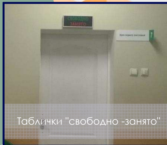
Таблички "свободно - занято"