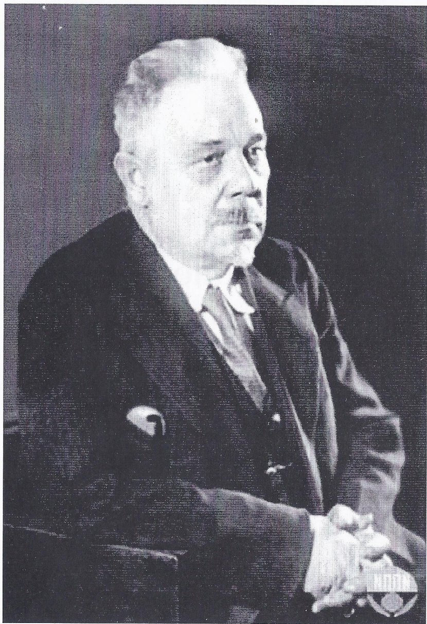
Георгий Дмитриевич Белоновский (1875—1950)