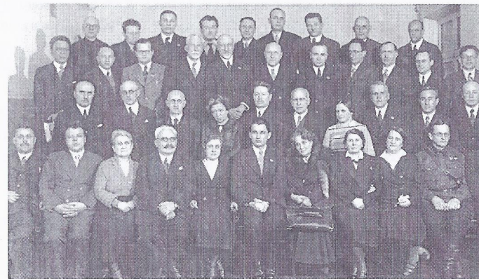
Члены ученого совета ЛенГИДУВа после заседания. 1940 г.