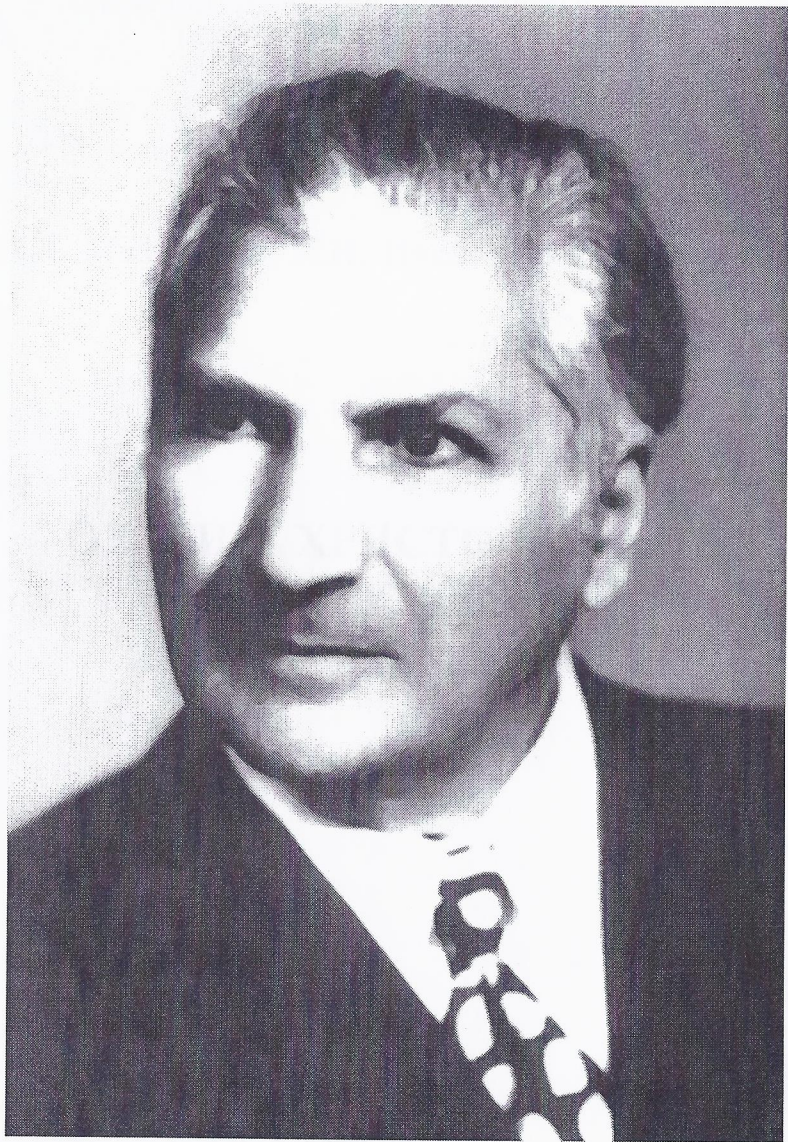
Овагим Христофорович Поркшеян (1910–1995)