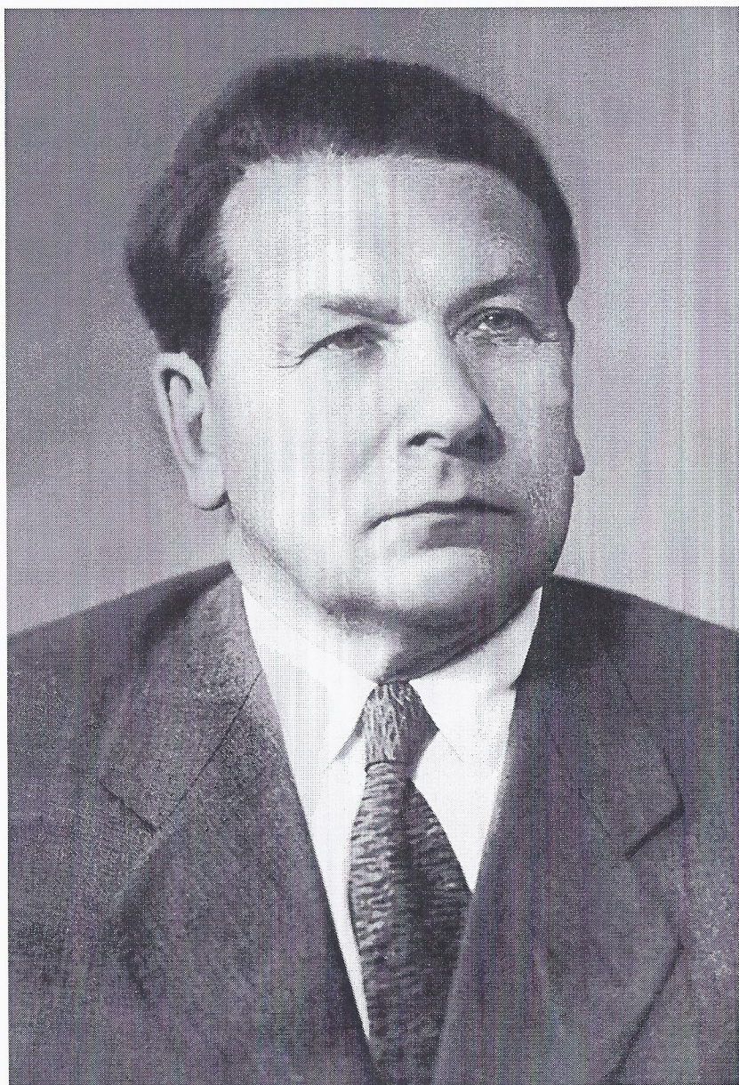
Александр Иванович Раков (1902–1972)