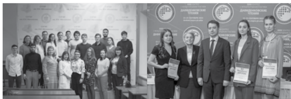
Впервые в этом году в рамках конгресса была проведена студенческая конференция