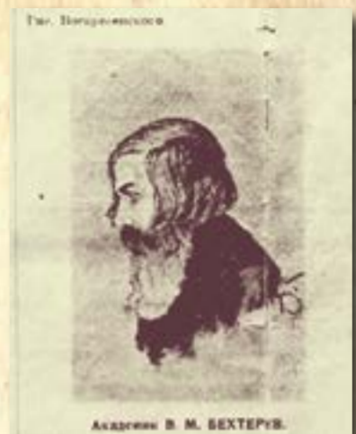
Академик В. М. БЕХТЕРЕВ