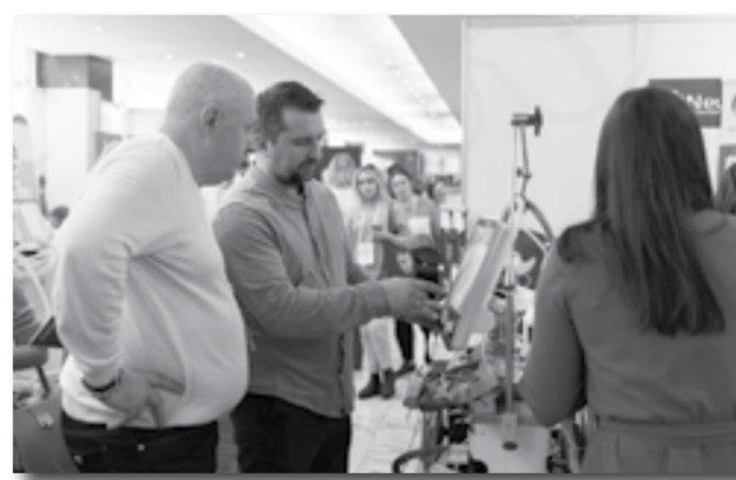
Выставка медицинского оборудования: всех интересует незнакомая техника!