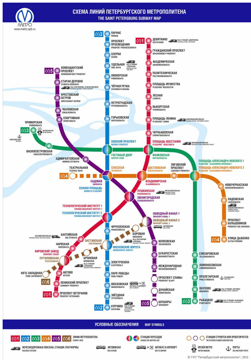
Схема Санкт-Петербургского метрополитена