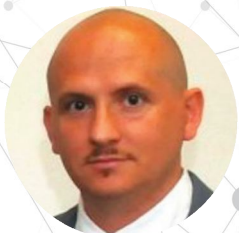
Профессор, Массимо Доминичи (Италия)