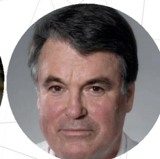
Профессор Вольф-Дитер Гримм (Германия)