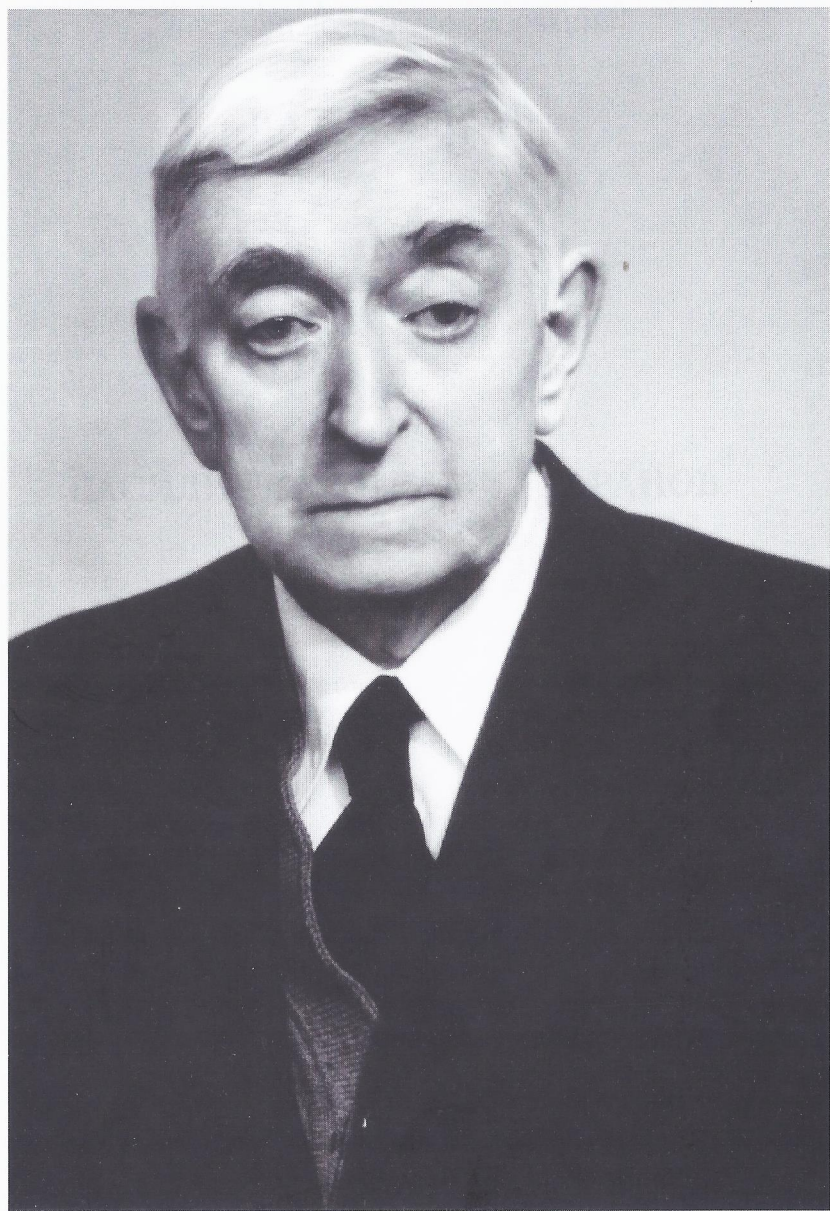
Василий Гаврилович Баранов (1900–1998)