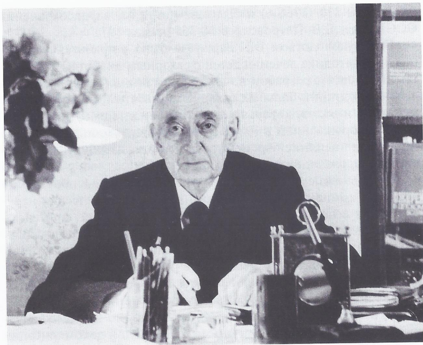
Академик АМН СССР В.Г. Баранов в рабочем кабинете. 1970-е годы

«Советский врач». — 1932. — № 13. — С. 1–10) он впервые в мире сформулировал представление об абсолютной и относительной недостаточности инсулина. Было показано, что при достижении нормогликемии с помощью инсулина у больных сахарным диабетом имеют место два явления — повышение чувствительности к инсулину и репаративные процессы \beta -клетках островков поджелудочной железы с повышением секреции инсулина. В 1927–1935 гг. В.Г. Баранов провел целый ряд исследований, показавших значение гормонов щитовидной железы, гипофиза, адреналина в переводе предстатий и скрытых стадий сахарного диабета в явный диабет.