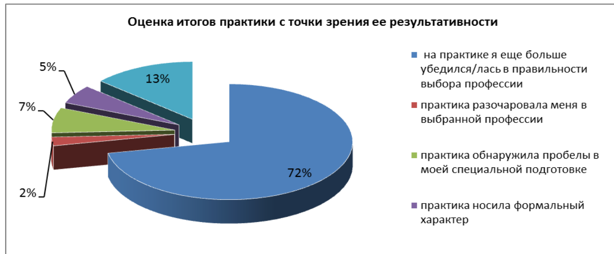
Рисунок 5 – Итоги практики с точки зрения ее результативности

Итоги прохождения практики были оценены студентами следующим образом (рисунок 5).