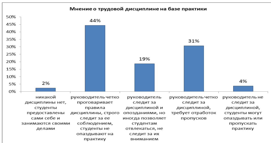
Рисунок 2 – Трудовая дисциплина

Трудовая дисциплина на базе практики получила следующую оценку (рисунок 2).