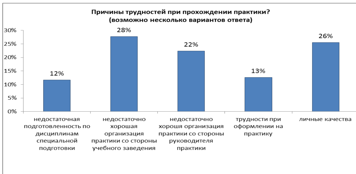
Рисунок 4 – Причины трудностей студентов в период прохождения практики

Из рисунка 4 видно, что те студенты, которые столкнулись с трудностями, считают, что личные качества помешали им полноценно и спокойно пройти практику - 26%; 28% - видят причину своих трудностей в недостаточно хорошей организации практики со стороны университета; 22% - остались не удовлетворены организацией практики со стороны руководителя практики.