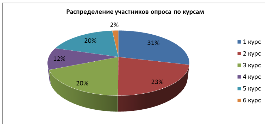
Рисунок 1 – Распределение участников опроса по курсам

Оценку организации проведения практики и собственных сформированных навыков, полученных в результате прохождения практики, было предложено оценить по 10-ти бальной системе. Результаты приведены в таблице 2.