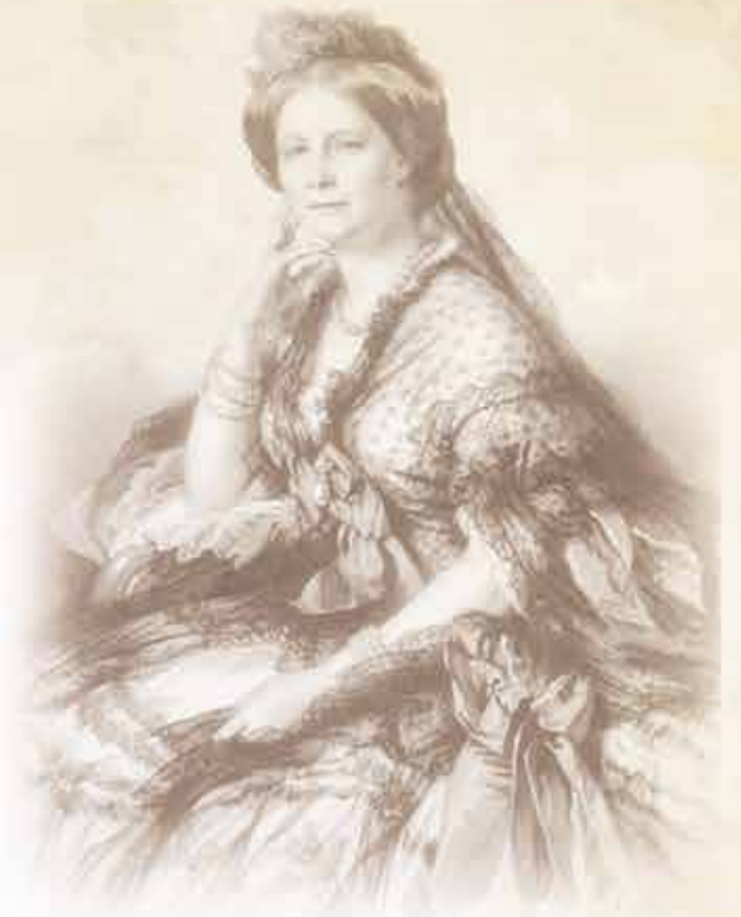
Учредительница Института — Великая княгиня Елена Павловна (1806–1873)

Санкт-Петербург, Кирочная ул., 41 8 (812) 303-50-00 www.szgmu.ru